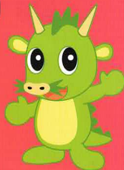
さいたま市 PRキャラクター つなが電ヌッ